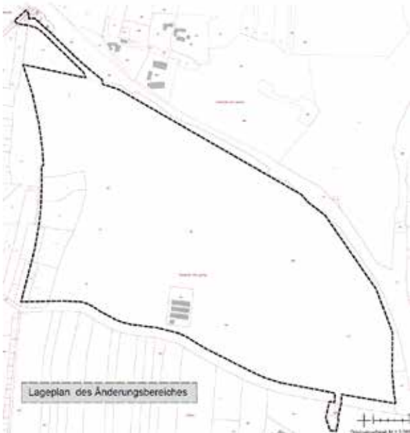
Lageplan mit räumlicher Abgrenzung des Geltungsbereiches des Bebauungsplanes